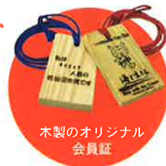
木製のオリジナル会員証