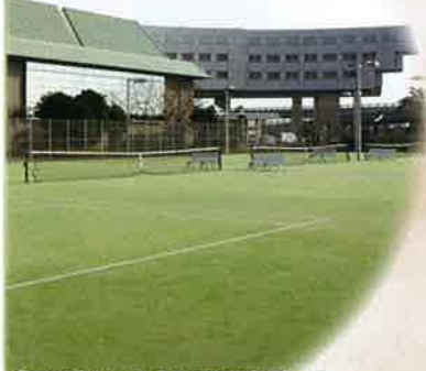
全5面(オムニコート)※2面はナイター可