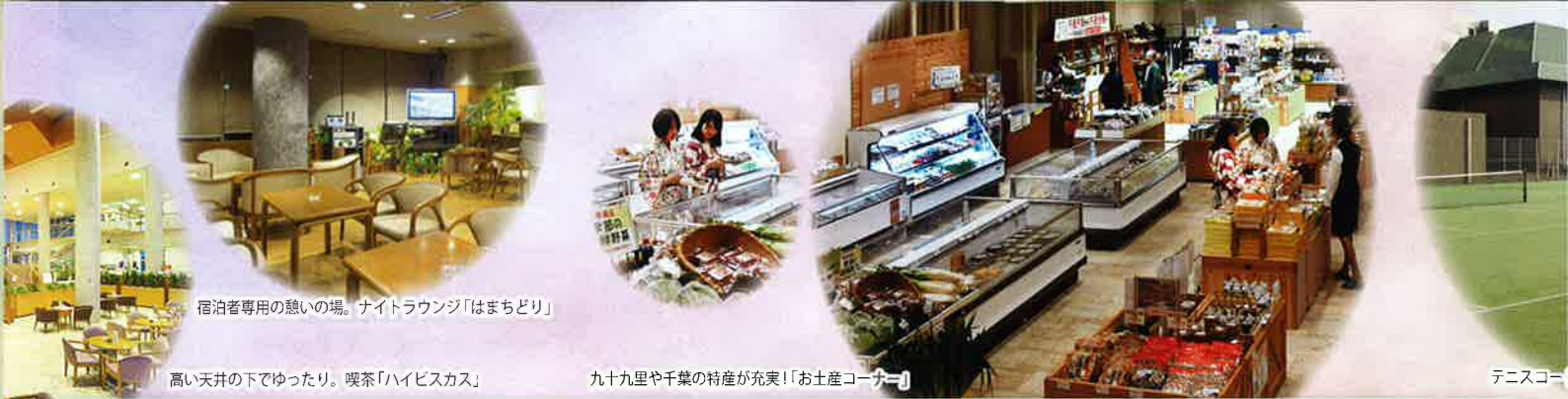
宿泊者専用の憩いの場。ナイトラウンジ「はまちどり」