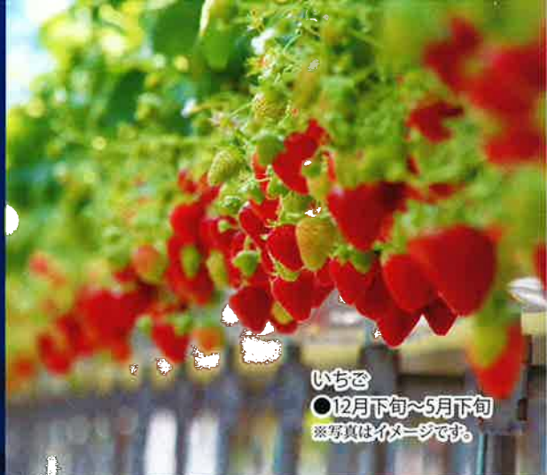
いちご ○12月下旬~5月下旬 ※写真はイメージです。