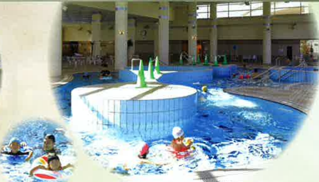
1年中快適な屋内温水プール「ドルフィン」