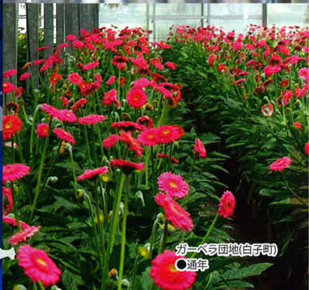
ガーベラ団地(白子町) ○通年