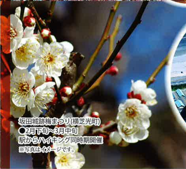
坂田城跡梅まつり(横芝光町) ○2月下旬~3月中旬 駅からハイキング同時開催 ※写真はイメージです。