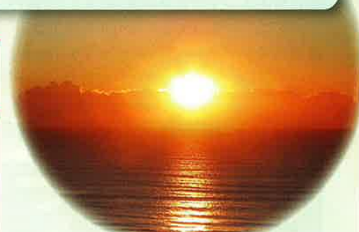
水平線から昇る日の出