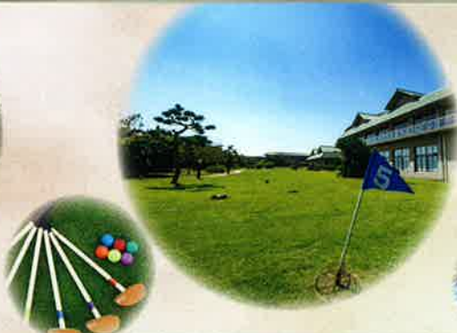
グラウンド・ゴルフ(日本グラウンド・ゴルフ協会認定コース)