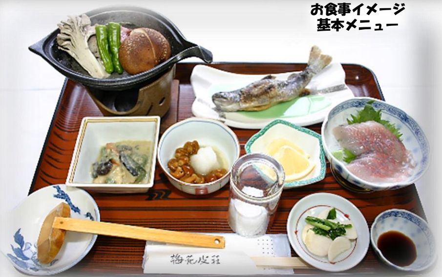
お食事イメージ 基本メニュー