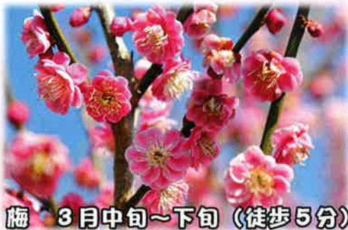
梅 3月中旬～下旬（徒歩5分）