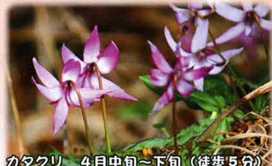
カタクリ 4月中旬～下旬（徒歩5分）