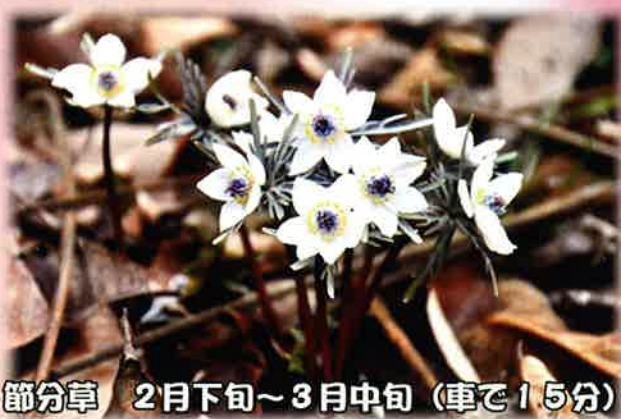
節分草 2月下旬～3月中旬（車で15分）