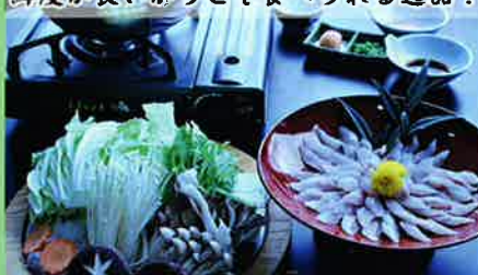
イワナのしゃぶしゃぶ 1人前 2,700円（消費税込） ※ご注文は2人前から