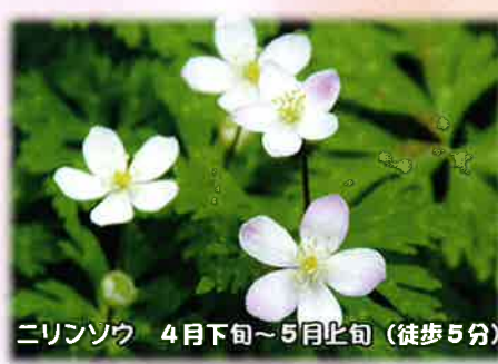
ニリンソウ 4月下旬～5月上旬（徒歩5分）