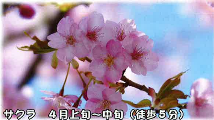
サクラ 4月上旬～中旬（徒歩5分）