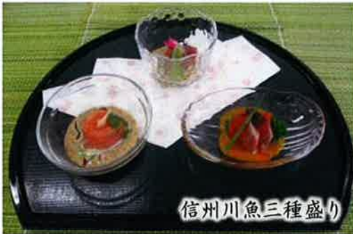
信州川魚三種盛り