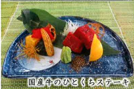
国産牛のひとくちステーキ