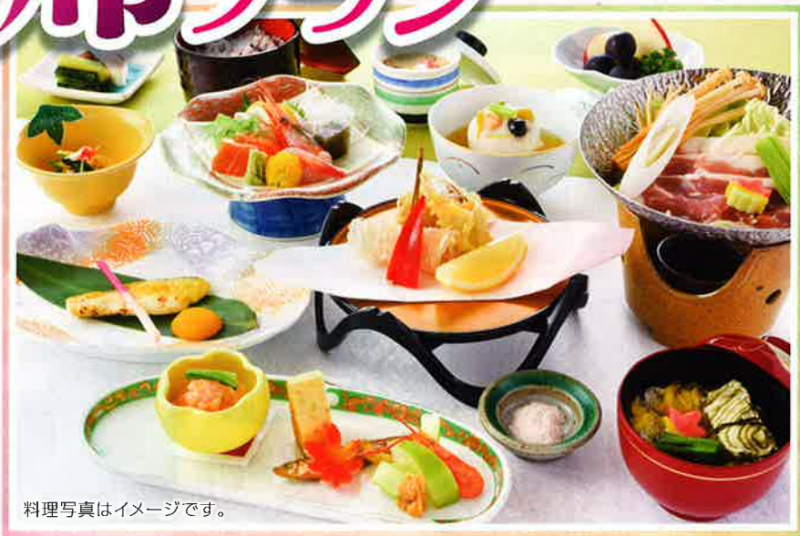
料理写真はイメージです。