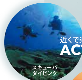
スキューバダイビング