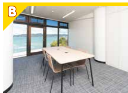
サテライトオフィス

開放的な空間でリラックスして仕事のできるスペース。 (テーブル 16席、ソファコーナー 4席)